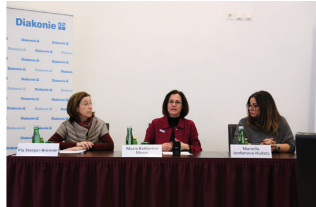
15. Dezember 2022: Pressekonferenz von Diakonie und AmberMed unter anderem zur Situation unversicherter Kinder in Österreich

für die ganze Familie. Besonders Kinder haben ohne Versicherung einen schlechteren Start ins Leben: Vielen unversicherten Familien fehlen Wissen und Ressourcen, um Kindern ein gesundes Leben zu bieten; bürokratische und sprachliche Hürden sind oft zu hoch, um Kinder bestmöglich medizinisch zu versorgen. Häufig verbunden mit Armutserfahrungen, beeinflussen Erkrankungen die körperliche, psychische und schulische Entwicklung von Kindern negativ – und das über ein ganzes Leben hinweg.